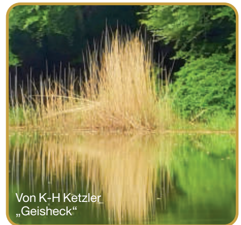
Von K-H Ketzler „Geisheck“