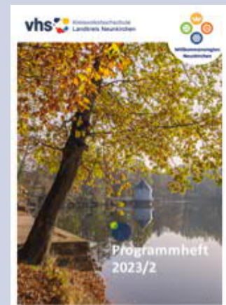
Titelbild: Es Türmche im Herbst