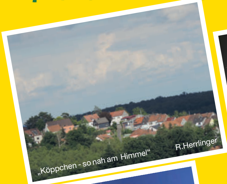
„Köppchen - so nah am Himmel“ R.Herrlinger

INFORMATIONEN rund um den Galgenberg Nr. 788/ 31.7.2020 Jahrgang 35