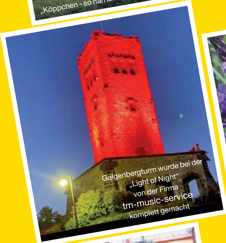
Galgenbergturm wurde bei der „Light of Night“ von der Firma tm-music-service komplett gemacht