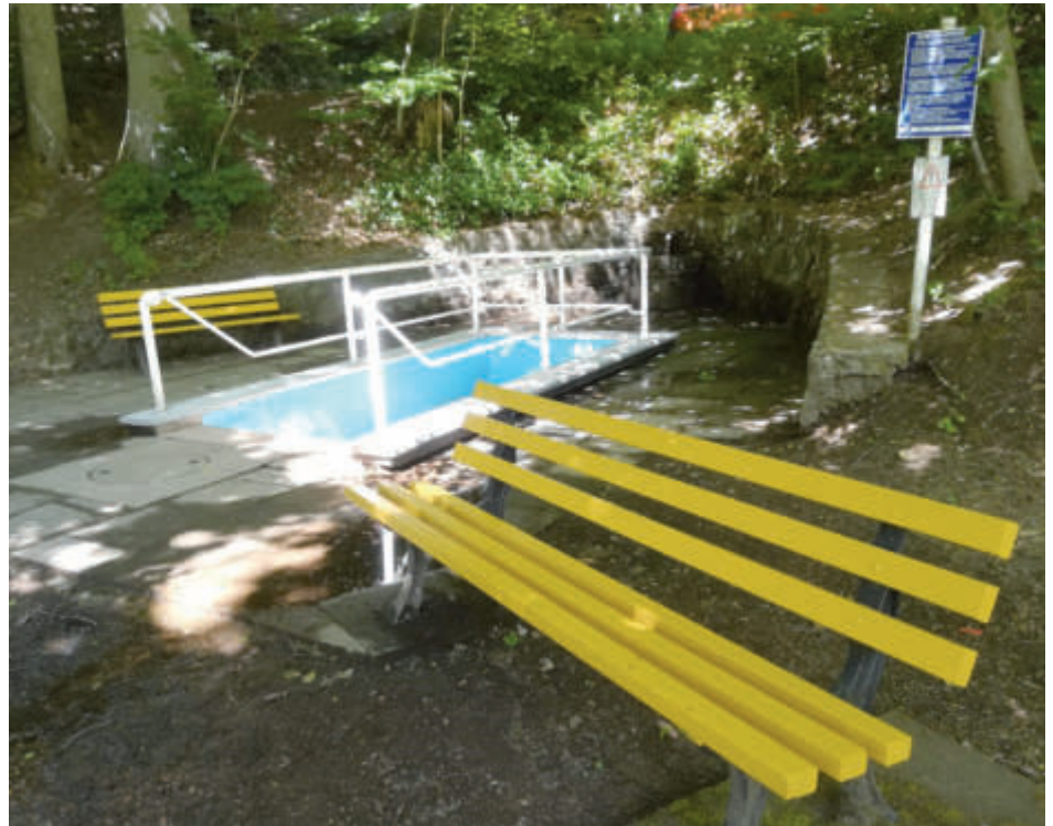
Die frisch renovierte Kneipp-Anlage in Spiesen