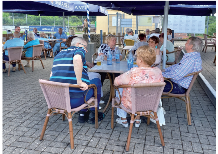
Nach einem Nachmittag mit guter Unterhaltung und einem schönen Beisammensein klang das Fest gegen neunzehn Uhr aus.

Im weiteren Verlauf der Veranstaltung wurde der obligatorische Ring Lyoner und Bier an die Mitglieder des Vereins ausgeteilt.