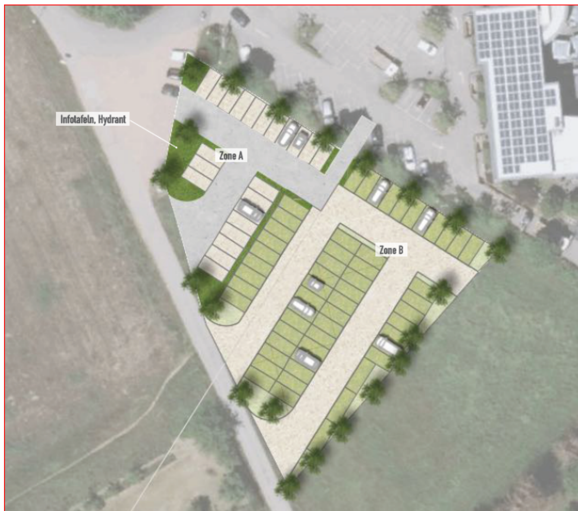
Abbildung 2: Städtebaulicher Entwurf zur möglichen Gestaltung der Stellplatzflächen

Der Geltungsbereich wird gemäß § 9 Abs. 1 Nr. 1 BauGB in Verbindung mit § 11 BauNVO als Sondergebiet „Rehabilitations- und Kommunikationszentrum“ festgesetzt (KERNPLAN, 2025 1 ). Dabei handelt es sich um dauerhafte ca. 730 m 2 (St1 = Zone A) und temporäre ca. 1.730 m 2 (St2 = Zone B) einnehmende Stellplatzflächen (VGL. KERNPLAN 2024 1 ).