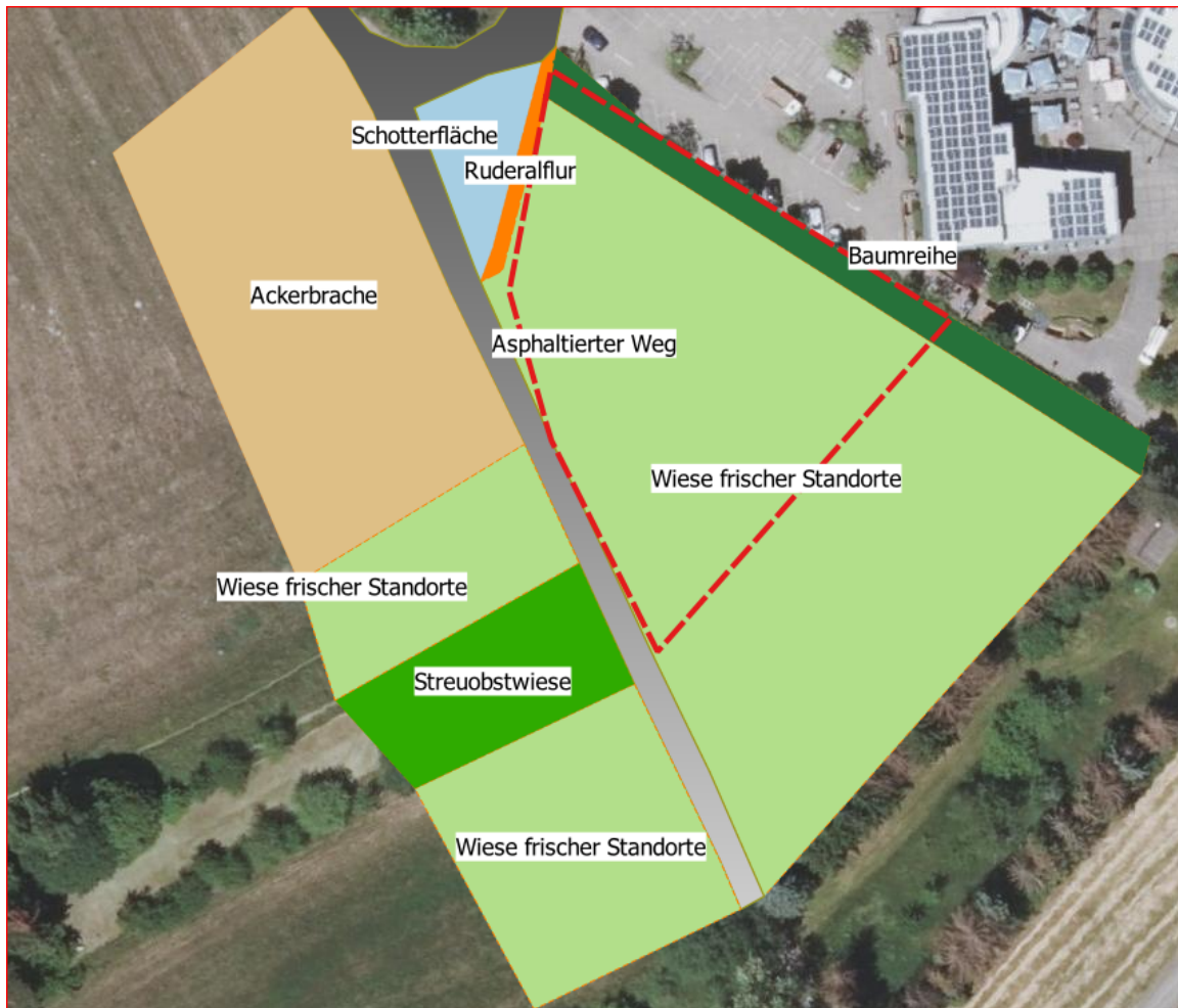
Abbildung 4: Biotopstruktur

An das Plangebiet grenzen eine als Wanderparkplatz genutzte Schotterfläche (3.2), asphaltierte Feldwege (3.1) sowie südlich Ackerbrachen, Wiesen und Streuobstwiesen an.