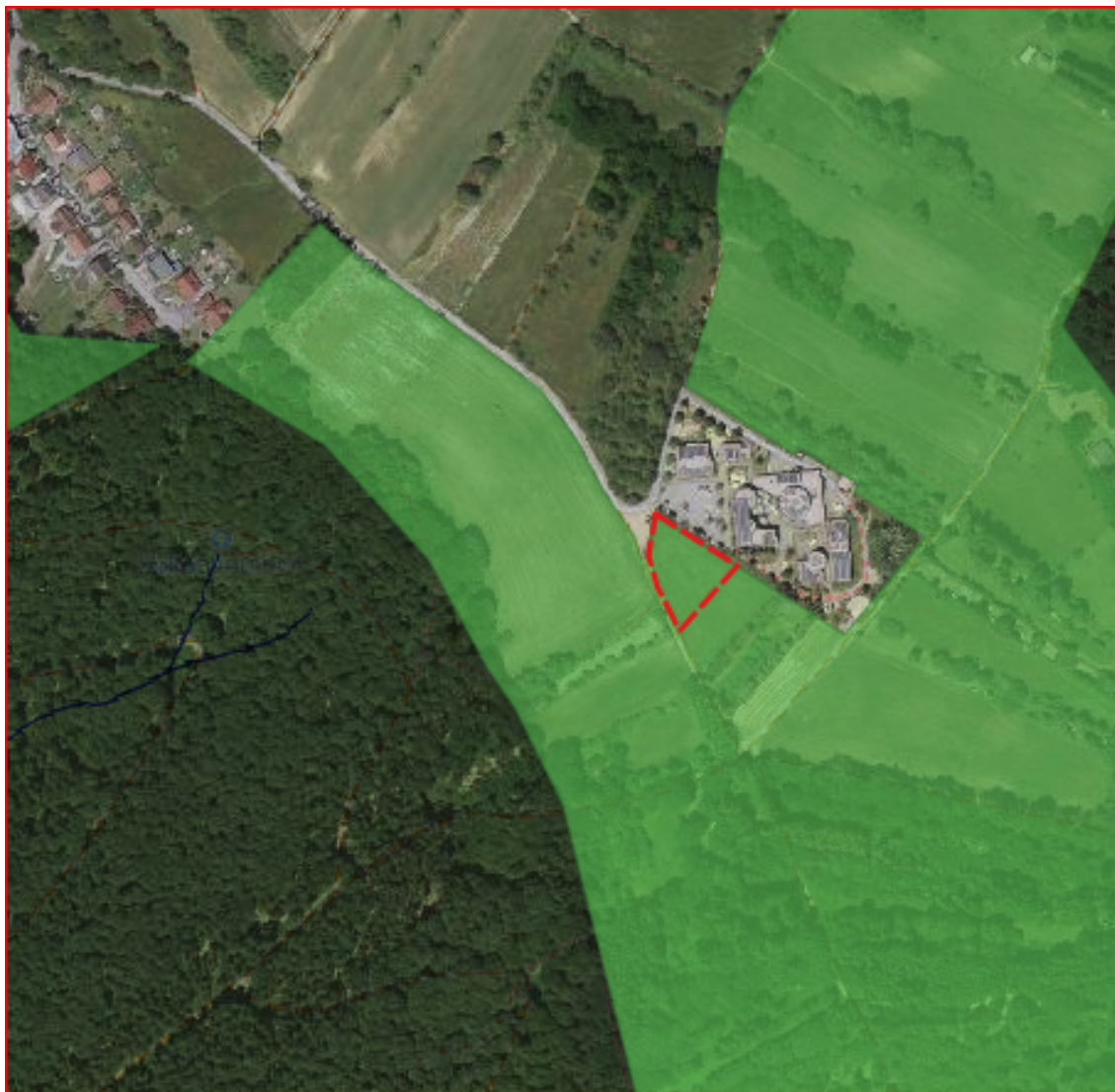
Abbildung 1: Geltungsbereich Bebauungsplan (rot umrandet) mit Landschaftsschutzgebiet (grün)

Der 0,26 ha große Geltungsbereich des Vorhabens Erweiterung Bebauungsplan „Auf'm Zimmerplatz/Am Nassenwald“ sowie der 0,24 ha Teiländerungsbereich des Flächennutzungsplans befinden sich unmittelbar südlich des Centrums für Freizeit und Kommunikation und des aus dem Jahr 2003 stammenden Bebauungsplans Auf'm Zimmerplatz/ Am Nassenwald am nordwestlichen Rand des großflächigen Landschaftsschutzgebiets „LSG-L_4_07_01 Baeckerwaeldchen, Kleberbach, Muehlental“.