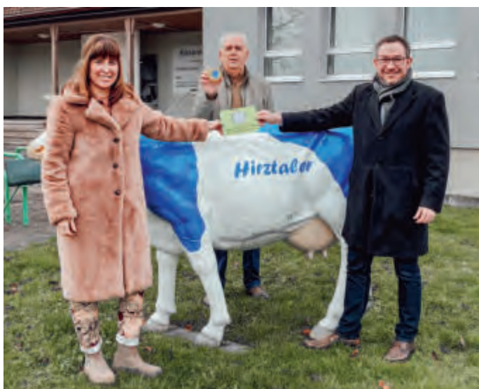
Seit Neustem erhalten die Partner der Regionalmarke ein Schild zur Zertifizierung, das erste Schild erhielt die Hirztaler Käserei im Dezember