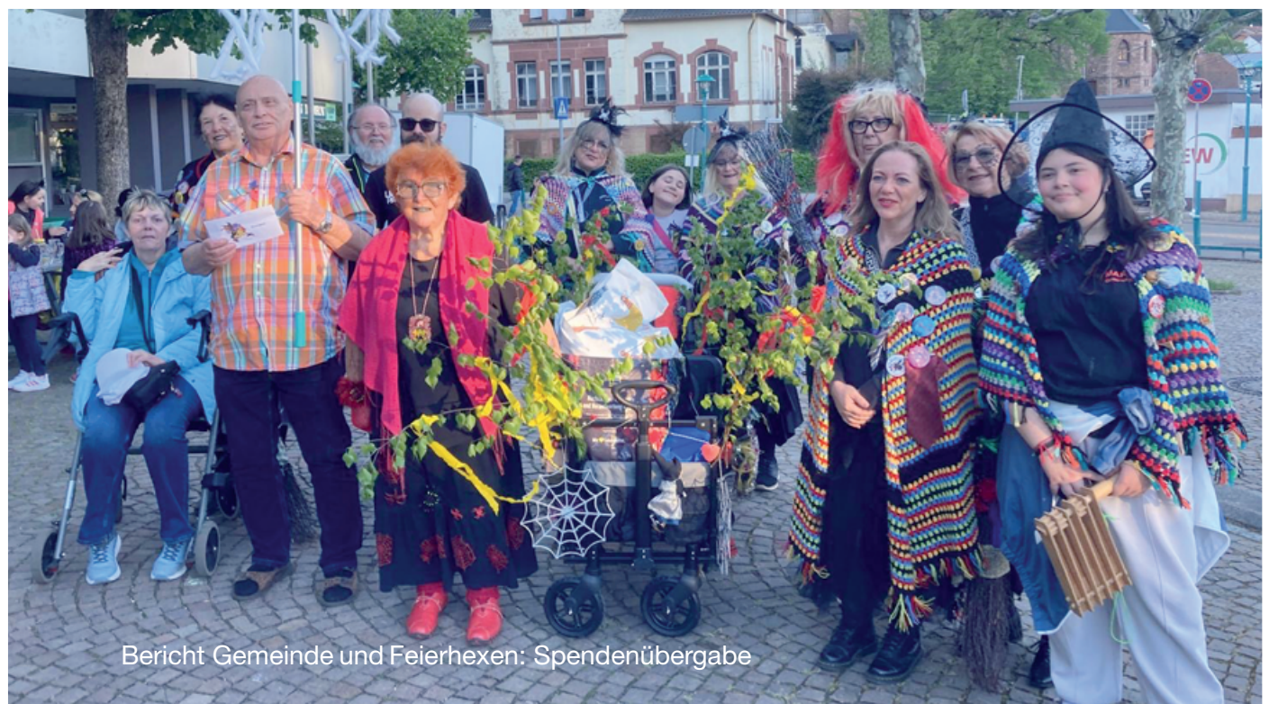
Bericht Gemeinde und Feierhexen: Spendenübergabe