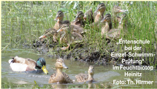
„Entenschule bei der Einzel-Schwimm-Prüfung“ im Feuchtbiotop Heinitz