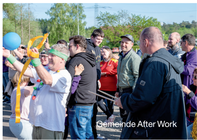
Gemeinde After Work